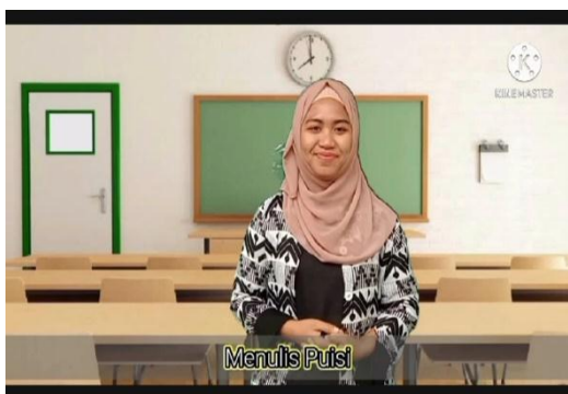
Gambar 2 Materi