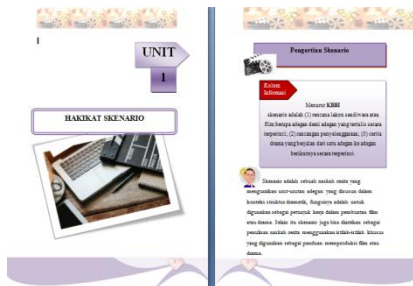
Gambar 4.3 Sistematika Berdasar KD

Ketiga, sistematika Pada buku ini menyajikan pengetahuan dan keterampilan menulis naskah drama yang disusun secara sistematis sesuai dengan silabus. Susunan buku pendamping ini dimulai dari merancang kompetensi dasar dan indikator yang sesuai dengan silabus. Mulai dari mengidentifikasi hingga mengontruksi teks naskah drama.