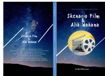
Gambar 4.4 Sampul Depan dan Belakang

Kelima, kegrafisan ada dua hal yang perlu diperhatikan dalam tampilan sebuah buku, yang pertama sampul dan yang kedua adalah desain isi buku. Desain sampul diarahkan pada empat komponen, yaitu tata letak, jenis dan ukuran huruf sampul, komposisi warna, dan ilustrasi sampul. Berikut adalah tampilan sampul depan, belakang, juga punggung buku.