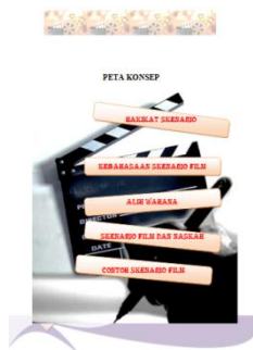
Gambar 4.2 Prosedur Buku Pendamping

Ketiga, sistematika Pada buku ini menyajikan pengetahuan dan keterampilan menulis naskah drama yang disusun secara sistematis sesuai dengan silabus. Susunan buku pendamping ini dimulai dari merancang kompetensi dasar dan indikator yang sesuai dengan silabus. Mulai dari mengidentifikasi hingga mengontruksi teks naskah drama.